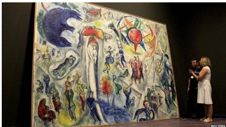
Chagall je označován jako průkopník modernismu.