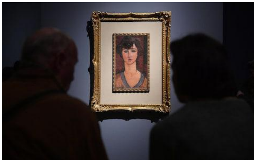
Jeden z obrazů vystavených v Palazzo Ducale v Janově v březnu 2017.