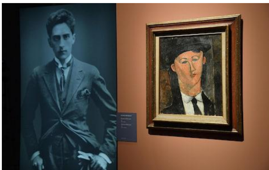
Výstava se konala minulý rok v Palazzo Ducale v Janově.

Obrazy jsou drženy specializovaným oddělením Carabinieri, polovojenské policie, zaměřujícím se na padělané umění, které se snaží zjistit, kdo mohl obrazy vytvořit.