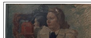
Kokoschka (1886-1980)"Dáma s lampionem"