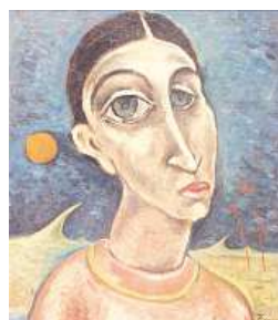
Portrét ženy, Jan Zrzavý. Originál stojí asi 190 tisíc.