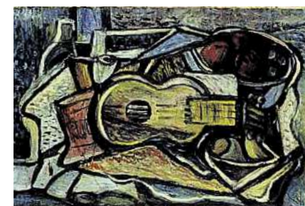
Zátíší s kytarou s podpisem Emila Filly. Bezcenné, hrubé a diletantské falzum.

Na trhu se podle sdružení Falzum STOP objevily například padělků těchto obrazů. Jen dvě poslední díla mají hodnotu přes dvě stě tisíc korun, pokud jsou pravá. Jako falza nemají hodnotu žádnou. Mezi nejčastější padělané umělce patří čeští modernisté Emil Filla, Pravoslav Kotík, František Kupka, Josef Lada, Jan Zrzavý, Josef Čapek či Kamil Lhoták.