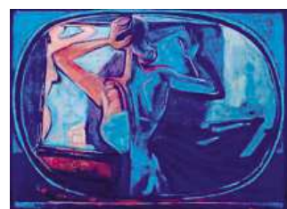
Pravoslav Kotík, Toaletta Falešný obraz vydávaný za dílo Pravoslava Kotíka stál sběratele 170 tisíc korun. Podle posudku Národní galerie je nalakovaný, aby působil staře, a umělsně zašpiněn. Podvržená jsou i razítka Kotíkovy rodiny na zadní straně. Rukopis obrazu neodpovídá pracem malíře z daného období. Obraz vznikl pravděpodobně podle fotografie originálu v 90. letech 20. století.