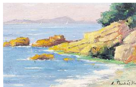
Pobřeží, signováno Antonín Procházka. Odhadní cena pravého díla je 30 tisíc korun.