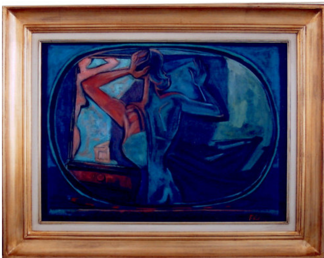
rozměry 43x58 cm tempera na lepence signováno vpravo dole P. Kotík